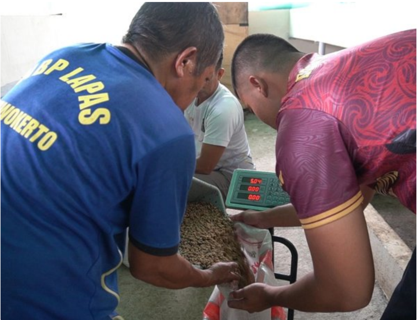
Dari Sampah Menjadi Manfaat, Lapas Purwokerto Panen Maggot Program Pengelolaan Terpadu

PURWOKERTO - Lapas Kelas IIA Purwokerto kembali menunjukkan komitmennya dalam inovasi pembinaan berbasis lingkungan melalui panen maggot hasil Program Pengelolaan Sampah Terpadu Kamis (11/12/2025).