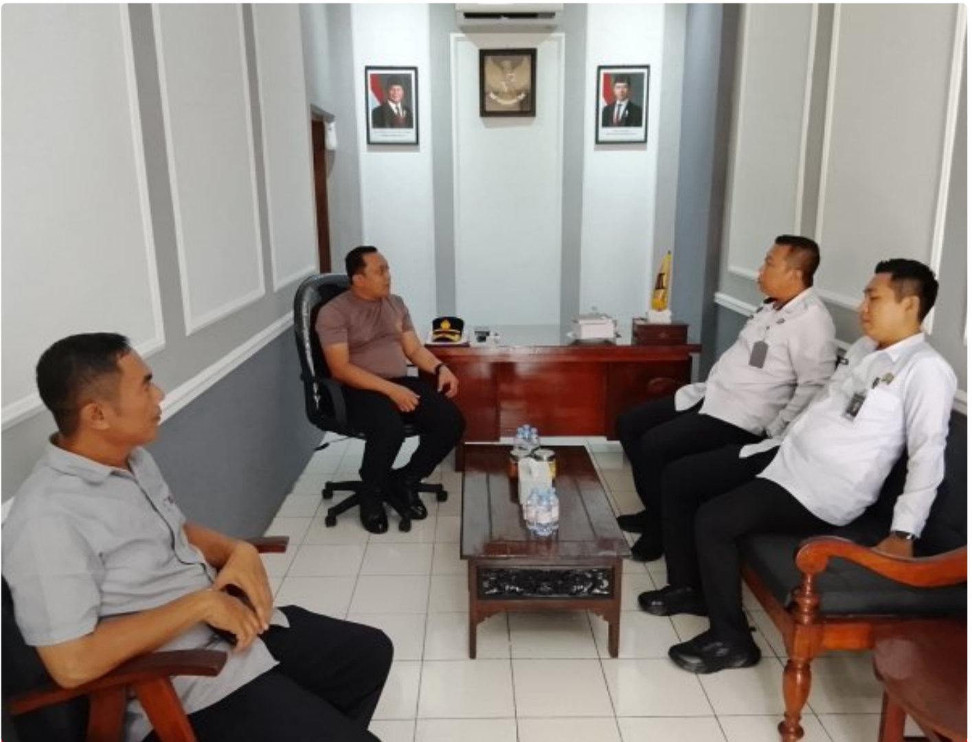
Jelang Nataru, Lapas Narkotika Purwokerto Jalin Sinergi Lintas Sektoral

Purwokerto – Dalam rangka memperkuat kesiapsiagaan menghadapi Hari Libur Natal dan Cuti Bersama Natal Tahun 2025 serta Tahun Baru 2026, Lembaga Pemasyarakatan (Lapas) Narkotika Kelas IIB Purwokerto melakukan kunjungan dan koordinasi dengan Aparat Penegak Hukum (APH) serta Pemadam Kebakaran Kabupaten Banyumas.