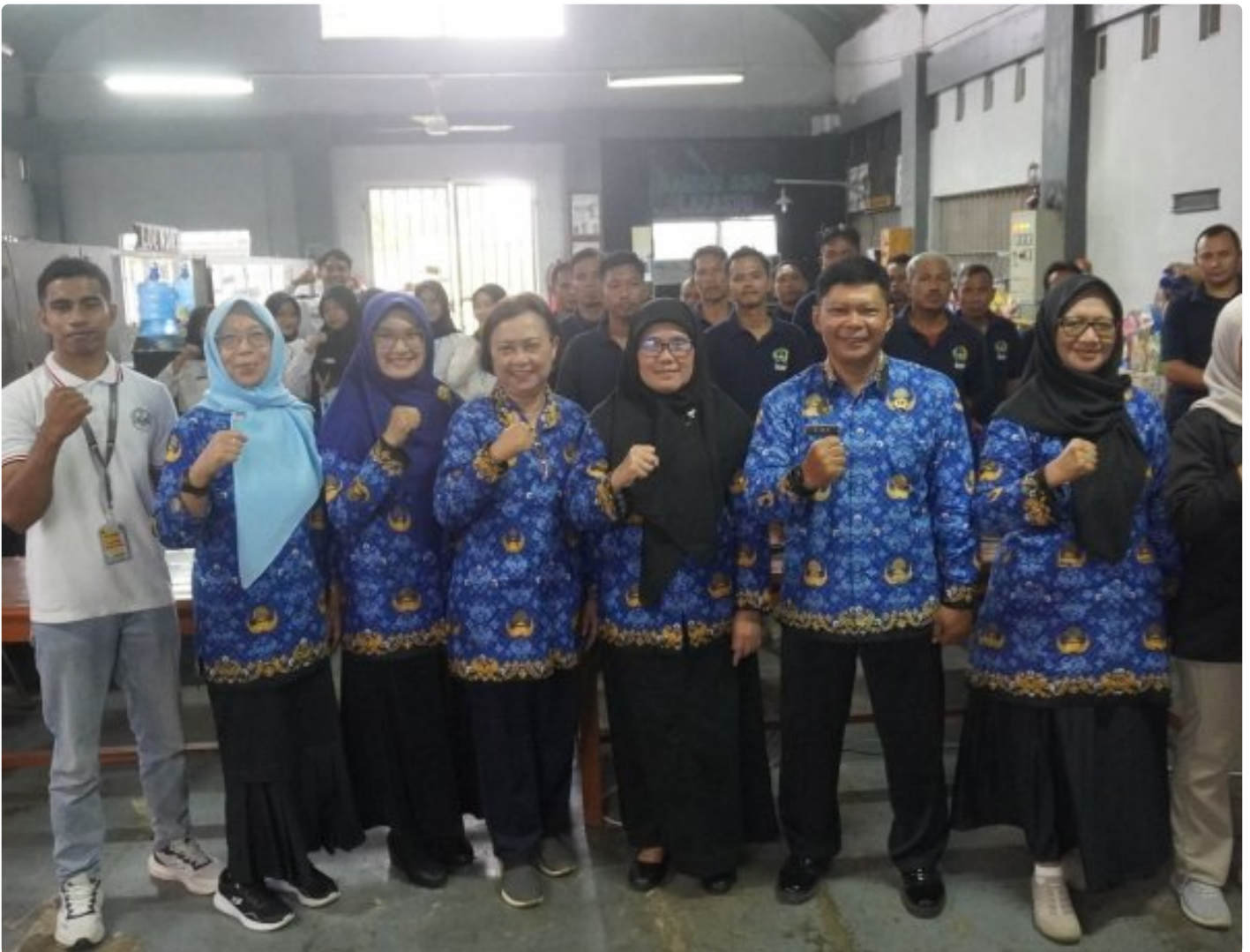
Lapas Kelas IIA Purwokerto Bekali Warga Binaan Keterampilan Budidaya Lebah Klanceng dan Pengemasan Madu

Purwokerto – Lembaga Pemasyarakatan (Lapas) Kelas IIA Purwokerto terus menunjukkan komitmennya dalam meningkatkan kualitas pembinaan kemandirian bagi warga binaan.