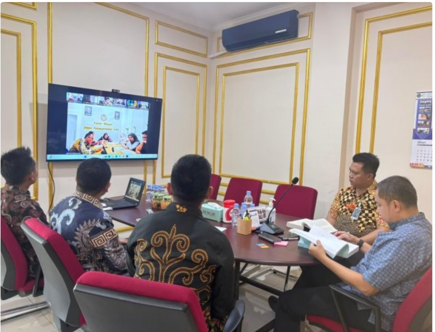
Lapas Purwokerto ikuti Diskusi Nasional Implementasi KUHP dan KUHPA Secara Virtual

Purwokerto – Lembaga Pemasyarakatan (Lapas) Kelas IIA Purwokerto mengikuti kegiatan Diskusi Implementasi Berlakunya Kitab Undang-Undang Hukum Pidana (KUHP) dan Kitab Undang-Undang Hukum Acara Pidana (KUHPA) yang diselenggarakan oleh Direktorat Jenderal Pemasyarakatan melalui video