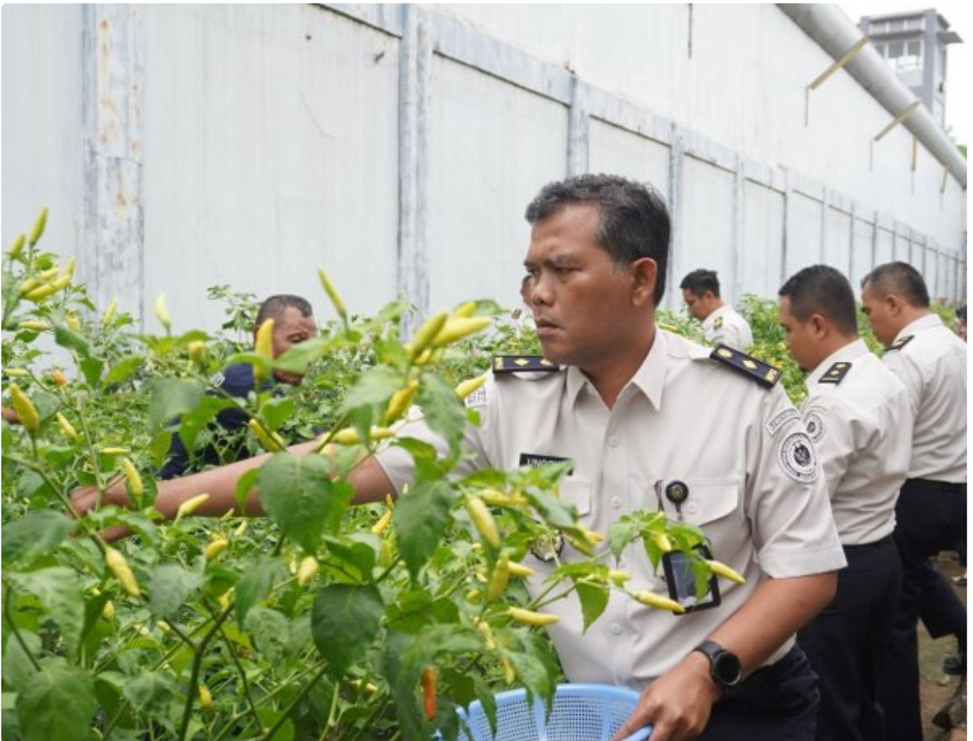
Panen Raya Serentak Pemasyarakatan, Lapas Purwokerto Dukung Ketahanan Pangan Nasional

Purwokerto - Lapas Kelas IIA Purwokerto turut berpartisipasi dalam Kegiatan Panen Raya Serentak Pemasyarakatan yang dilaksanakan secara nasional pada Kamis, 15 Januari 2026.