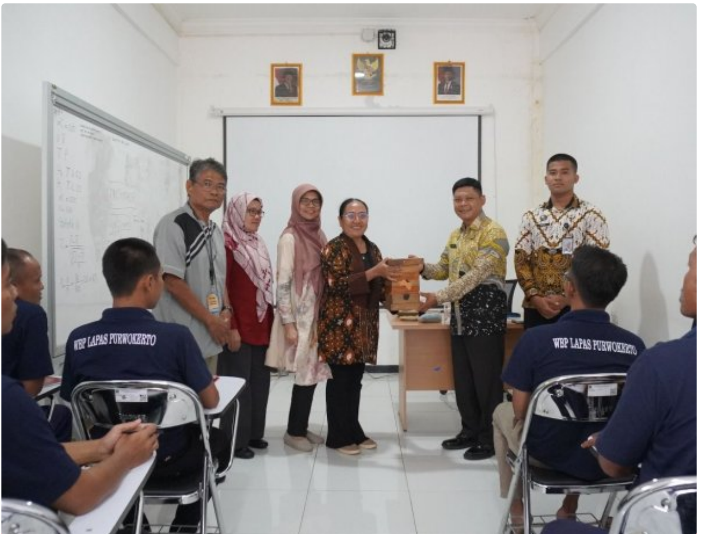
Pelatihan Budidaya Lebah Klanceng Tingkatkan Keterampilan Warga Binaan Lapas Kelas IIA Purwokerto

PURWOKERTO - Pelatihan budidaya lebah klanceng diselenggarakan di Lapas Kelas IIA Purwokerto pada Jumat, 12 Desember 2025, sebagai bagian dari program pembinaan kemandirian.