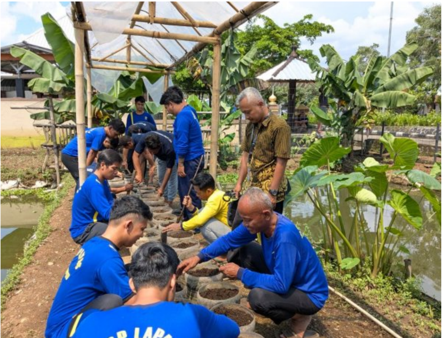
Pelatihan Budidaya Melon di Lapas Purwokerto, Peningkatan Keterampilan WBP dalam Teknik Pemindahan Bibit

Purwokerto - Lembaga Pemasyarakatan Kelas IIA Purwokerto kembali melaksanakan program pembinaan kemandirian melalui kegiatan Pelatihan Budidaya Melon pada Jumat, 5 Desember 2025.