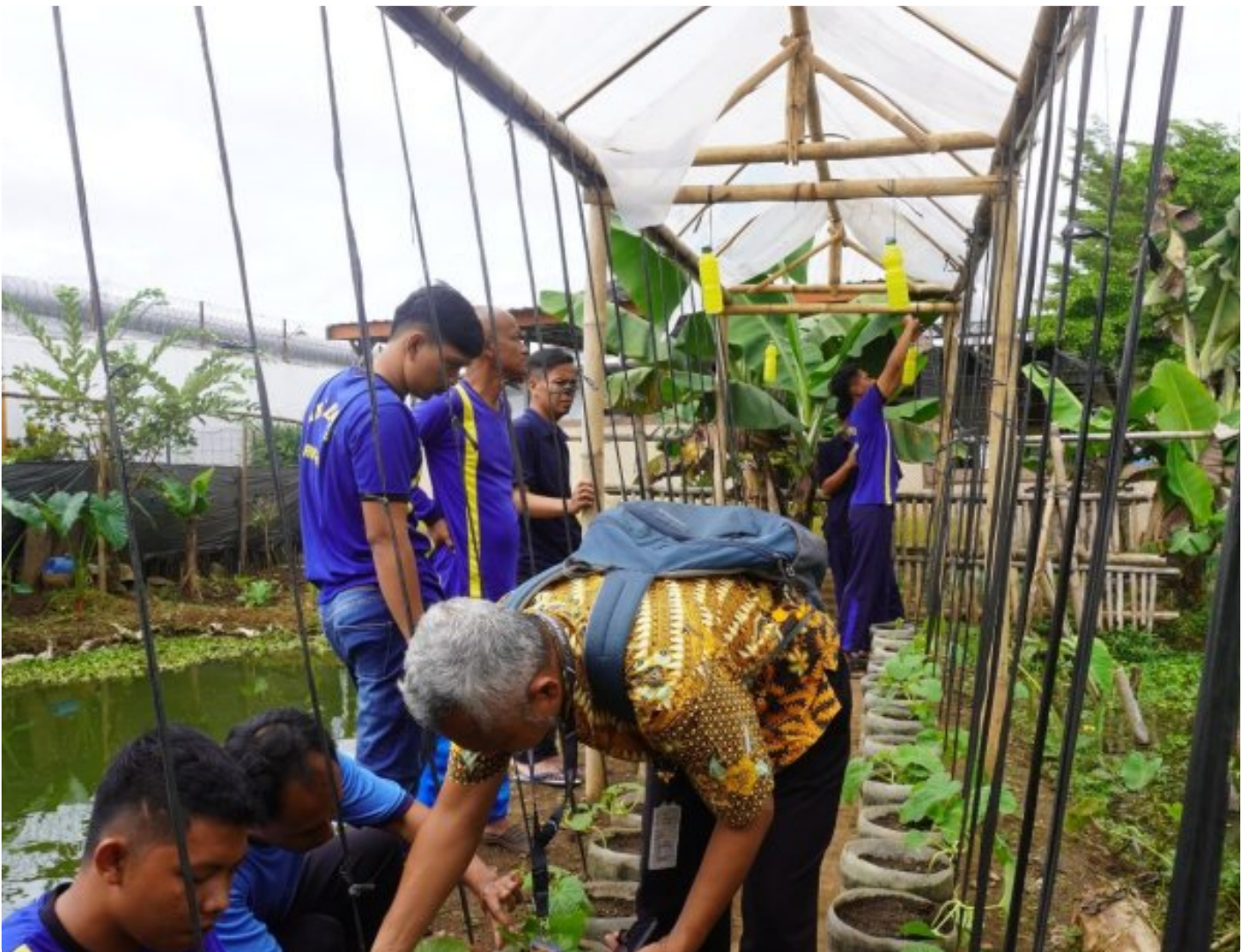
Pembinaan Kemandirian Terus Berjalan, Warga Binaan Lapas Purwokerto Ikuti Pelatihan Budidaya Melon Tahap 2

PURWOKERTO - Lapas Kelas IIA Purwokerto kembali melaksanakan kegiatan pembinaan kemandirian di bidang pertanian melalui pelatihan budidaya tanaman buah melon, yang dilaksanakan di area Bimbingan Kerja (Bimker). Kegiatan ini merupakan lanjutan dari program pelatihan Tahun Anggaran 2025 yang