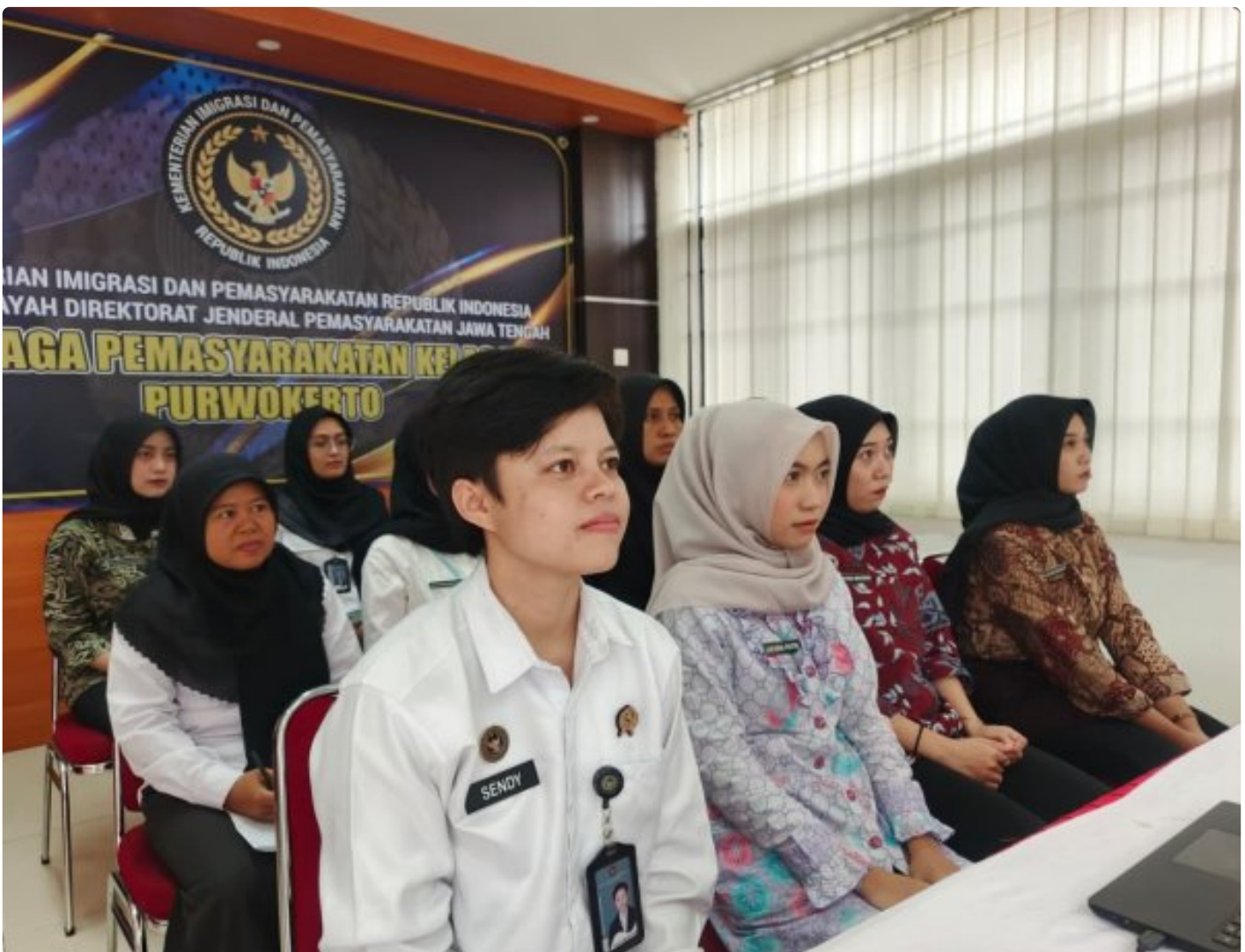
Sosialisasi Pelaksanaan Vaksinasi HPV bagi Pegawai di Kementerian Hukum, HAM, dan Imigrasi Pemasyarakatan melalui Zoom Meeting