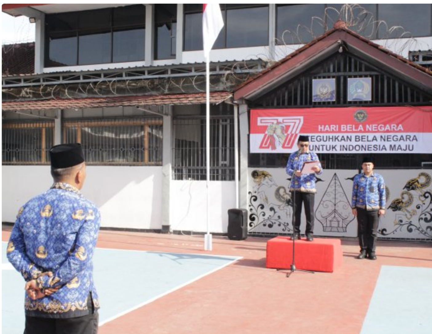
Wujud Nyata Pengabdian, Lapas Narkotika Purwokerto Gelar Upacara Peringatan Hari Bela Negara Ke-77

Purwokerto - Lembaga Pemasyarakatan (Lapas) Narkotika Kelas IIB Purwokerto menggelar Upacara Peringatan Hari Bela Negara ke-77 tahun 2025 dengan mengusung tema "Teguhkan Bela Negara Untuk Indonesia Maju", Jumat (19/12/2025).